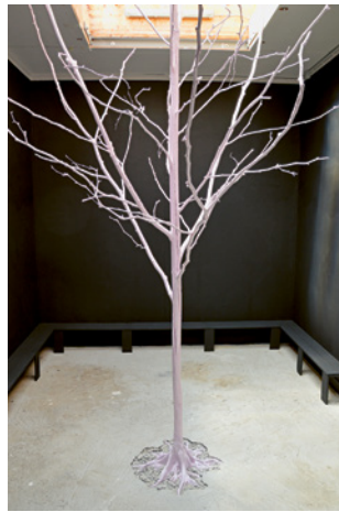
Marten Schech: PINKHOUSE, 2019

»Werden, das ist die Losung!« präsentiert plastische, zeichnerische und druckgrafische Werke aus der Sammlung des Ernst Barlach Hauses. Die Ausstellung ist ein Gemeinschaftsprojekt mit dem Kunstgeschichtlichen Seminar der Universität Hamburg.