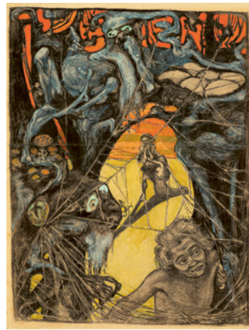
Im Zauberwald / In the Enchanted Wood, 1899