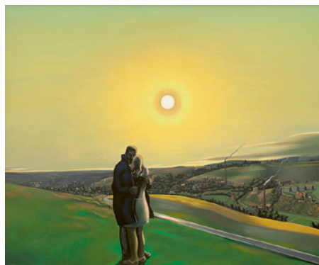
Wolfgang Mattheuer: Das vogtländische Liebespaar / Vogtland Lovers, 1972 Albertinum / Galerie Neue Meister, Staatliche Kunstsammlungen Dresden

In early 2020 the Dresden Albertinum opens an extensive Barlach retrospective significantly based on items from the Ernst Barlach Haus. The project is the occasion for an East/West exchange: in return the Albertinum loans major works from its collection of art in the GDR. The presentation covers post-war paintings and sculptures, 'socialist contemporary art' from the 1960s and 70s and works by a younger generation of artists. A wide spectrum of styles and positions can be discovered – from objective to expressive, figurative to abstract, conformist to critical.