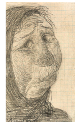
Kopf einer Säuerin / Head of a Drinker, 1906