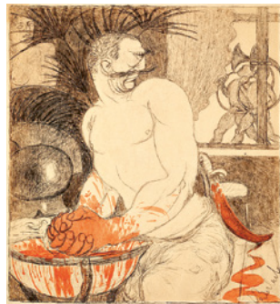
Marokko-Lärm / Morocco Hubbub, 1906