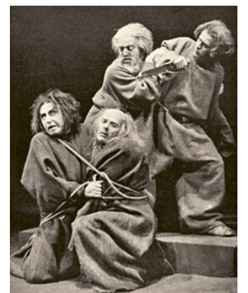
Barlachs Drama Die Sündflut im Stadttheater Köln / Barlach’s play The Flood at the Stadttheater in Cologne, 1927