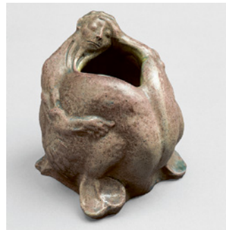
Nöck / Merman, um / c. 1903/04