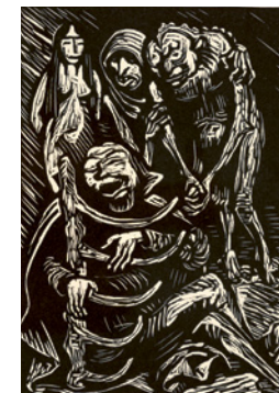
Der Harfner / The Harper, 1923