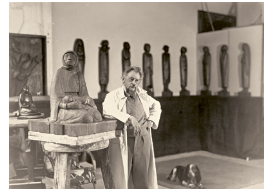
Ernst Barlach in seinem Atelier / in his studio, 1935

‘Becoming, That’s the Word!’ presents sculptures, drawings and prints from the Ernst Barlach Haus collection. The exhibition is a joint project with the Department of Art History, Universität Hamburg.